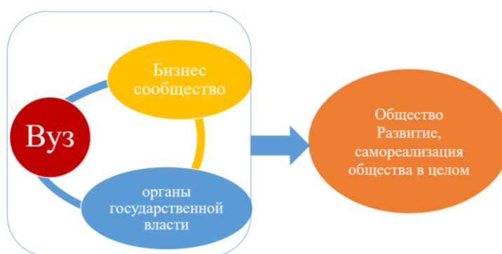
Рисунок 1. Схема взаимодействия в государственно-частном партнерстве (составлено авторами)

Важнейшая задача системы образования — развитие совместно с экономикой, повышение конкурентоспособности будущих специалистов в области современных технологий и глобальных мировых трендов развития. На наш взгляд конкурентоспособный специалист может быть подготовлен в системе взаимовыгодного сотрудничества образовательных организаций органов государственной власти и бизнеса (рис. 1).