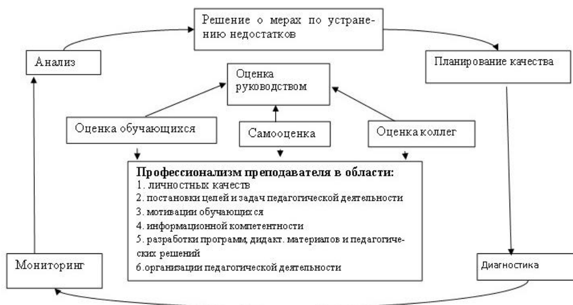
Рисунок 1. Модель оценки качества деятельности преподавателя профессионального иноязычного образования

Представим модель оценки качества деятельности преподавателя профессионального иноязычного образования на рисунке 1.