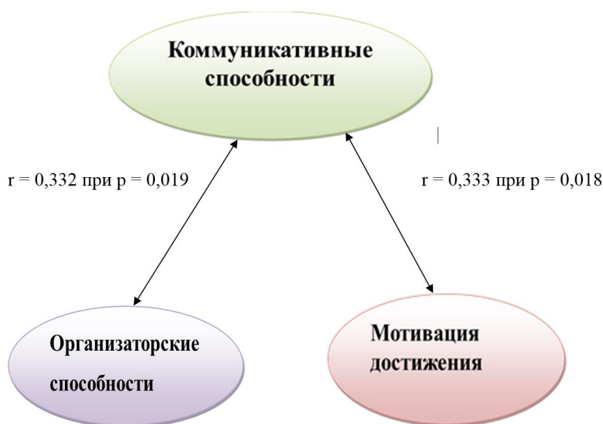
Рисунок 3. Взаимосвязь коммуникативных способностей и мотивации достижения подростков

На следующем этапе исследования мы изучали взаимосвязь показателей коммуникативных способностей и мотивации достижения подростков. Расчет коэффициента ранговой корреляции Ч. Спирмена для установления взаимосвязи изучаемых переменных показал наличие значимых корреляционных связей между переменными (рисунок 3):