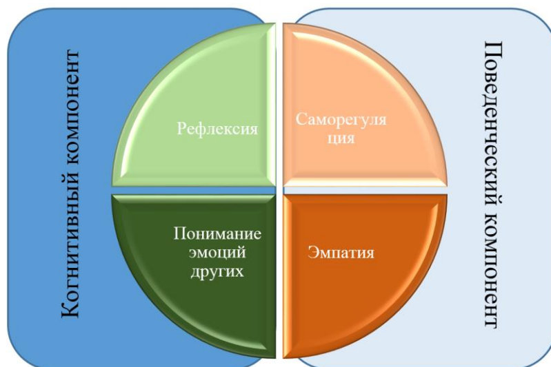
Рисунок 3. Модель эмоциональной компетентности (рисунок авторов)

Под эмоциональной компетентностью мы понимаем совокупность знаний об эмоциональной сфере (состояниях, переживаниях, чувствах и т.д.), умений определять содержание эмоций, опознавать эмоциональные состояния и переживания, умений сопереживать, сочувствовать и содействовать другим людям, а также навыков осознания и регуляции собственных эмоциональных реакций, развитие которых позволяет выстраивать социальное поведение, общение и взаимодействие.