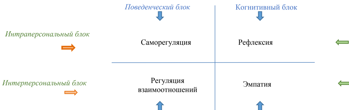
Рисунок 1. Функциональные блоки и базовые элементы эмоциональной компетенции в исследовании Юсуповой Г.В. [23]

Четыре последних блока выступают в инструментальном значении функциональным механизмом успешной адаптации в социуме [23].