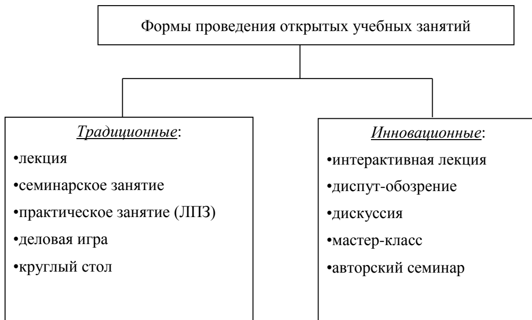
Рис. 2. Формы проведения открытых учебных занятий

Посещение и обсуждение всех мероприятий кафедрами и методическими комиссиями факультетов может показать, что применение современных методов обучения, в частности, проведение интерактивных, диалоговых лекций способствует активизации внимания студентов, стимулированию их мыслительной деятельности непосредственно во время занятия. Проведение круглых столов и деловых игр вырабатывает у студентов навыки дискуссии, публичного выступления, в также дает возможность симитировать предполагаемые производственные ситуации, возникающие в ходе профессиональной деятельности специалиста. Использование данных методов обучения повышает эффективность учебного процесса, что, в свою очередь, в итоге способствует повышению качества высшего образования.