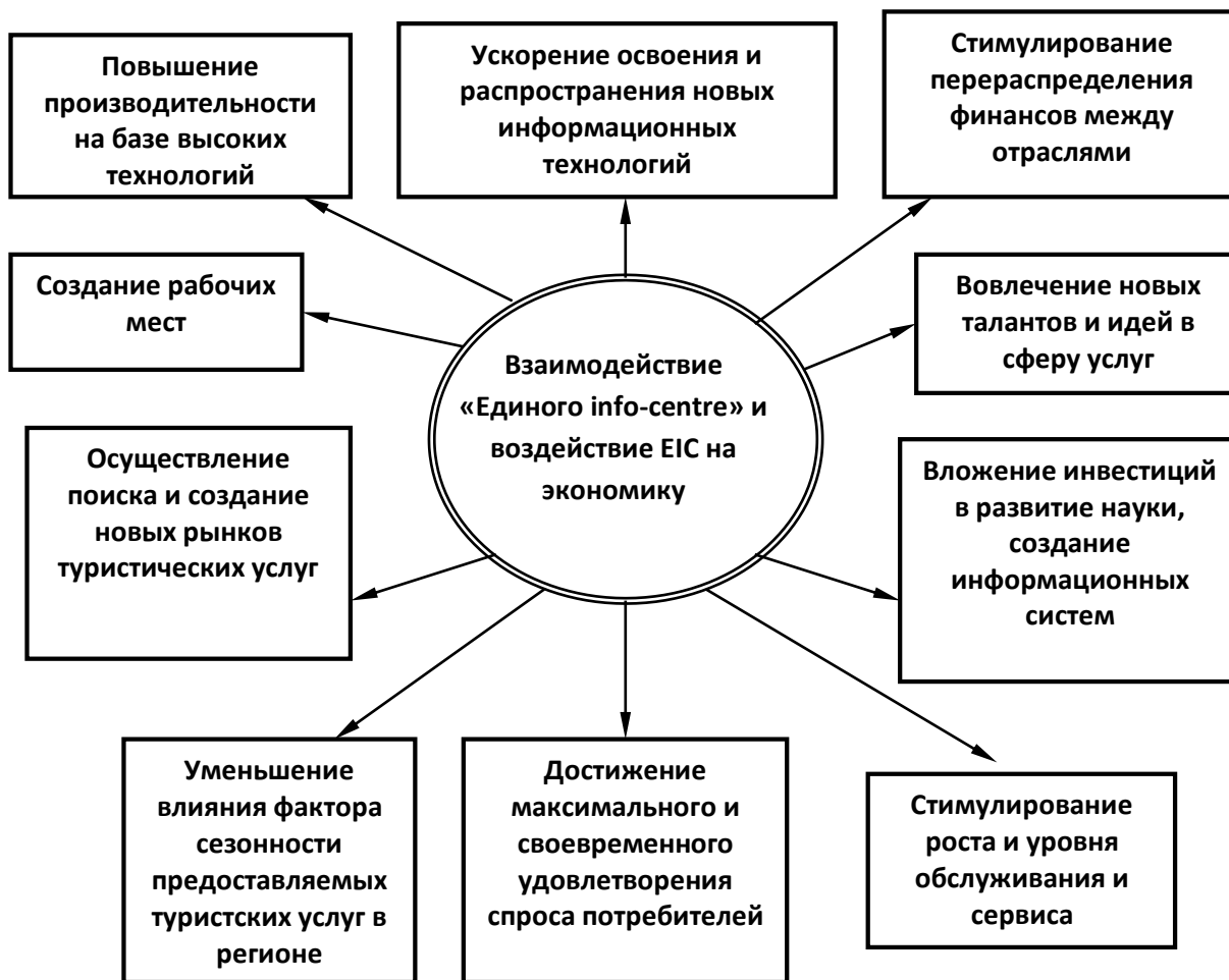
Рисунок 2. Структура воздействия ЕПИАЦ на экономику КБР

Таким образом, проведенный анализ свидетельствует о востребованности реализации такого проекта как ЕПИАЦ и его экономической целесообразности.